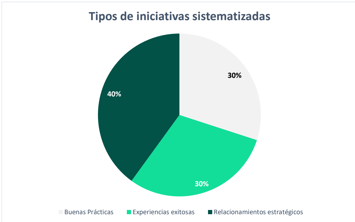
Gráfico 2. Tipos de iniciativas sistematizadas

De las diez (10) iniciativas registradas, el mayor porcentaje (40%) corresponde a relacionamientos estratégicos que la Unidad del SPE ha efectuado con diferentes actores. El restante se distribuye en igual porcentaje entre las buenas prácticas (30%) y las experiencias exitosas (30%). Se concluye con ello y revisando los temas de los relacionamientos efectuados, que el énfasis para la obtención de resultados en los proyectos, se ha dado en la gestión de apoyo con pares, cooperantes o actores del sector privado que cuenten con una mayor experiencia o experticia en temas relacionados con la inclusión laboral de poblaciones vulnerables, la recolección y aprovechamiento de residuos y la implementación de metodologías complementarias para el análisis de la información, estadísticas e indicadores del mercado laboral colombiano.