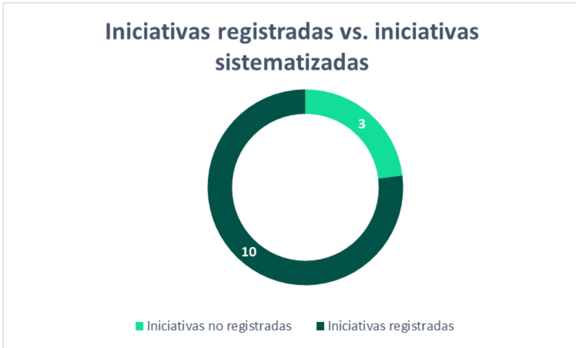
Gráfico 1. Iniciativas registradas vs. Iniciativas sistematizadas

Las diferentes áreas de la Unidad registraron un total de 13 iniciativas. Una vez realizada una revisión exhaustiva de la información consignada, se encontró que sólo 10 de ellas cumplían con todos los criterios presentados en la metodología para ser considerada una buena práctica, experiencia exitosa o relacionamiento estratégico. Las 3 iniciativas que no fueron incluidas en el portafolio cumplieron de manera parcial con los criterios y no contaban con productos tangibles y resultados que pudieran ser medibles y replicables en entidades de similares características.