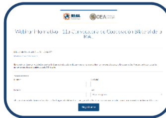
Seminarios Web y Foros