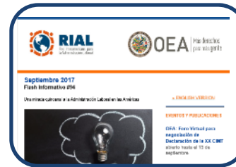
Boletín de Noticias