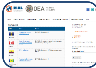
Portafolio de Programas