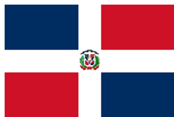
MT - República Dominicana